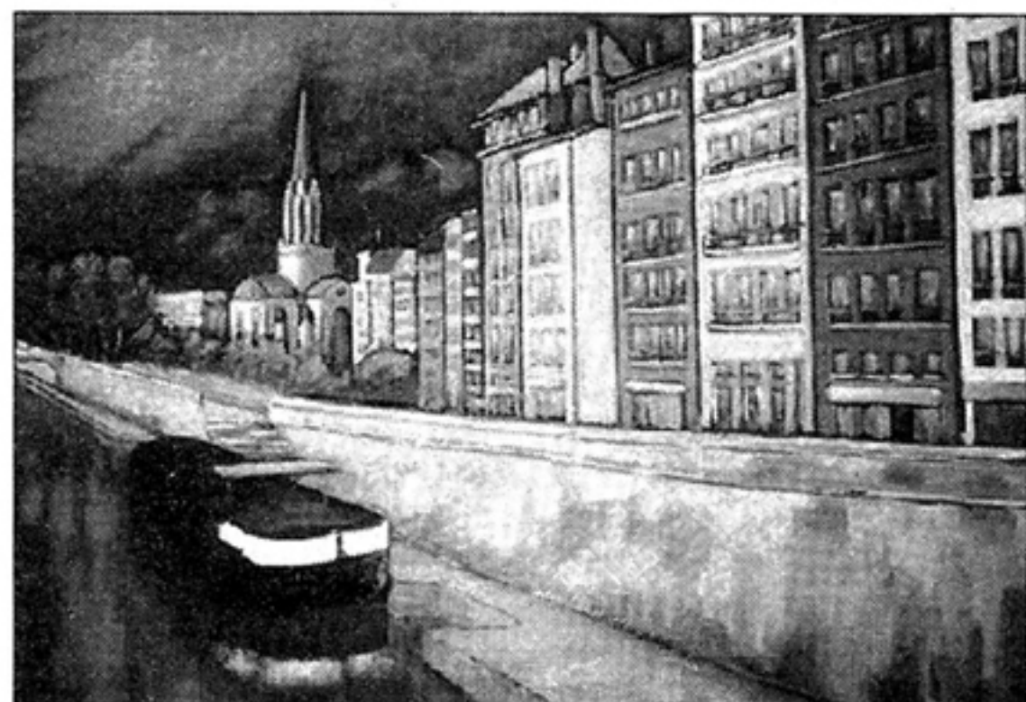
« Quai Fulchiron » : Lyon un des thèmes favoris, ses quais, ses ponts, ses toits et façades

www.andre-persillon.com Exposition de 11 heures à 18 heures Espace Berthelot-Salle Edmond Locard 16 avenue Berthelot Lyon 7